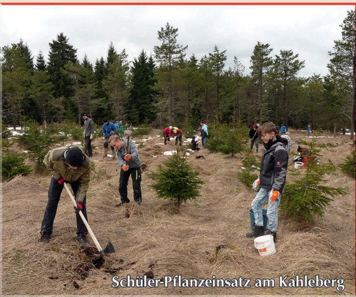
Schüler-Pflanzeinsatz am Kahleberg