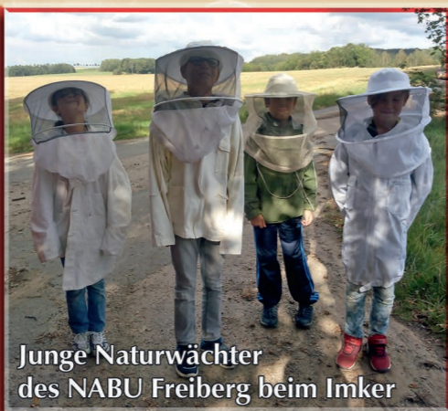
Junge Naturwächter des NABU Freiberg beim Imker