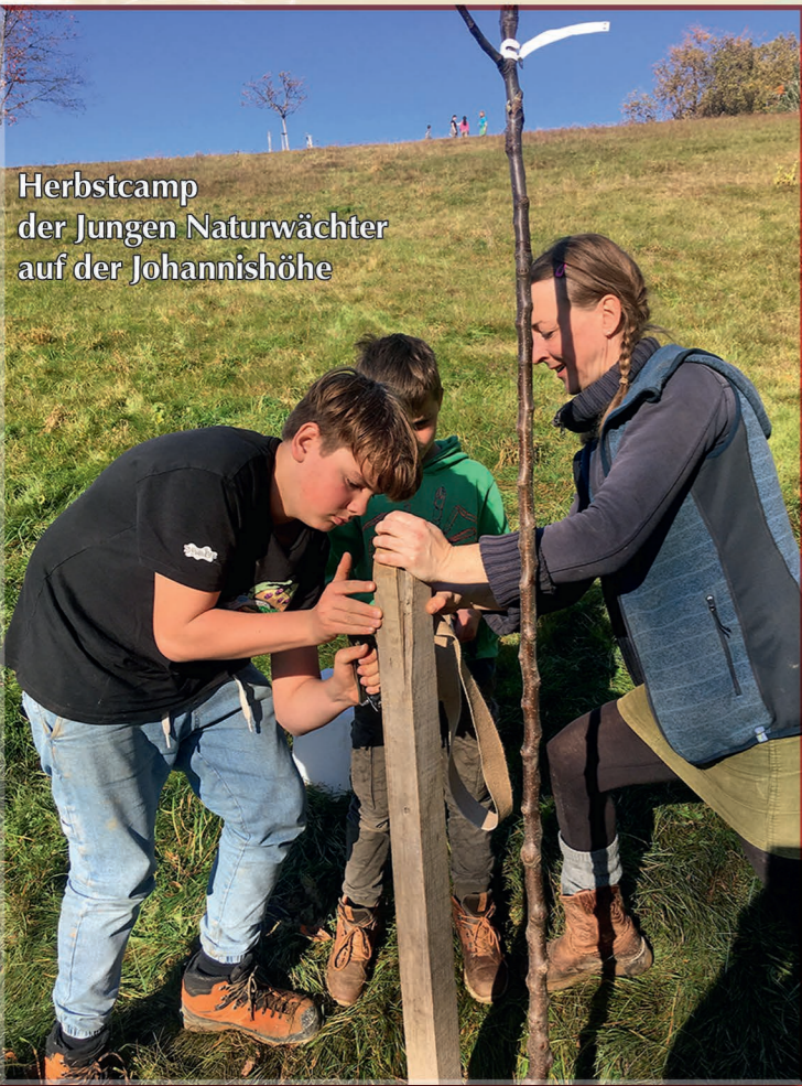
Herbstcamp der Jungen Naturwächter auf der Johannishöhe