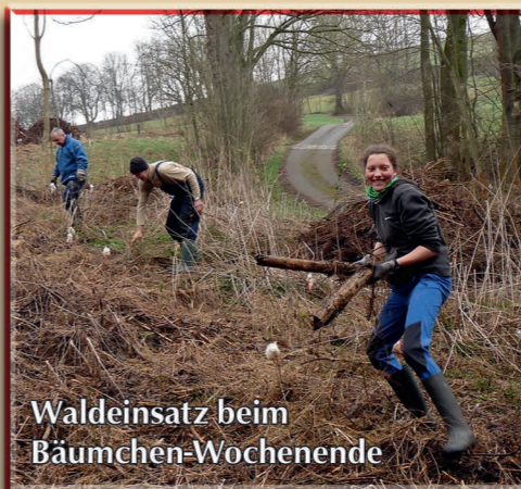
Waldeinsatz beim Bäumchen-Wochenende