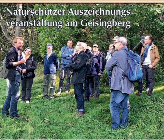
Naturschützer-Auszeichnungs- veranstaltung am Geisingberg