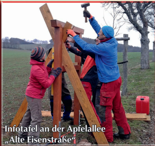
Infotafel an der Apfelallee „Alte Eisenstraße“