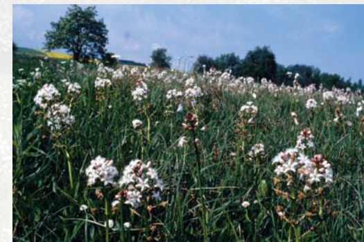
Kleinseggenrasen mit Fieberklee bei Voigtsdorf

Pflege: jährliche Mahd mit Grünmasseberäumung, günstiges Wasserregime, Verhinderung des Eindringens schadstoffbelasteten Wassers