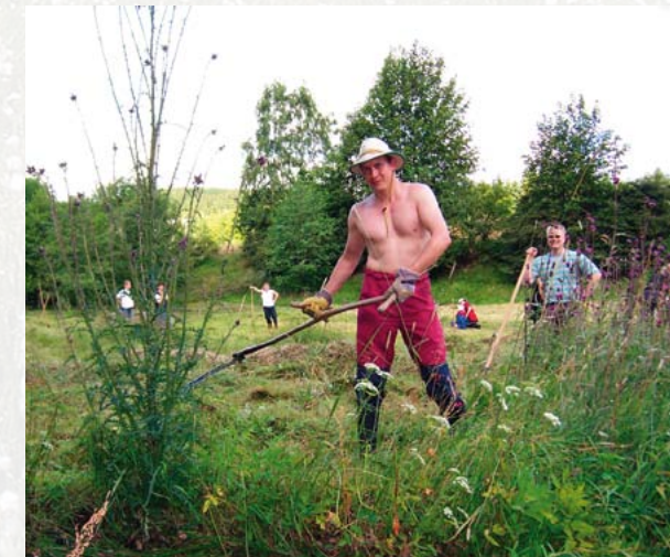
Mähen mit der Sense – auch heute noch beim Heulager der Grünen Liga Osterzgebirge praktiziert

Jährlich gemähtes Grünland nennt man Wiese , eine vorwiegend mit Nutztieren beweidete Fläche hingegen Weide . Die Zwischenform zwischen beiden Formen heißt Mähweide . Bleibt Grünland längere Zeit ungenutzt, können sich mehr oder weniger stabile Brachestadien bilden, bevor sich Gehölze auszubreiten beginnen. Rasen hingegen bezeichnet sehr kurzhalbiges Grünland. Dies kann natürlich („Trockenrasen“), durch Beweidung entstanden („Borstgrasrasen“) oder durch sehr häufige Mahd bedingt sein („Zierrasen“, „Scherrasen“).