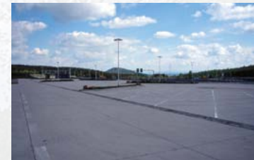
Viele Hektar artenreicher Wiesen verschwanden 1999 unter dem Asphalt der Grenzzollanlage Zinnwald.