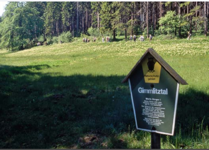
Das Naturschutzgebiet Gimmlitztal sichert einige der artenreichsten Wiesen des Ost-Erzgebirges. In Zukunft soll das NSG deutlich erweitert werden.

NATURA 2000 Lebensräume von gesamteuropäischer Bedeutung erhalten werden. Dazu zählen unter anderem: Flachland-Mähwiesen, Berg-Mähwiesen, Borstgrasrasen und feuchte Hochstaudenfluren.