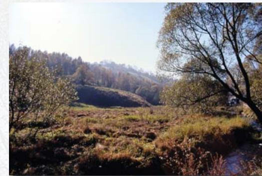
brachliegender Binsensumpf an der Schweinitz

Pflege: einfache Mahd erhält den Zustand, zweimal Mähen pro Jahr kann zu artenreicheren Feuchtwiesen oder Kleinseggenrasen führen