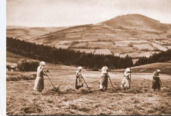
Heuwenden bei Geising

1990 erfolgte ein erneuter, abrupter Wechsel. Landwirtschaft schien nun keine Bedeutung mehr zu haben, Grünlandnutzung im Gebirge schon gar nicht.