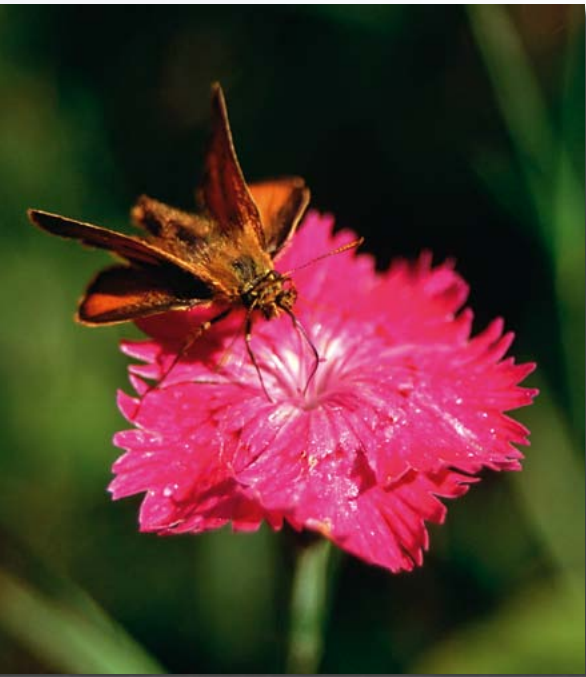
Buschnelke mit Dickkopffalter

Wann haben Sie sich das letztmal die Ruhe gegönnt, auf einer bunten Blumenwiese zu liegen, dem Brummen einer Hummel oder dem Zirpen einer Heuschrecke zu lauschen?