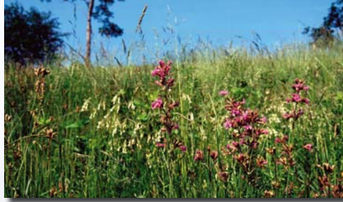
Pechnelkenwiese bei Hartmannsbach

Pflege: jährliche Mahd (meist nur ein Schnitt erforderlich), auch gelegentliche Schaf- oder Ziegenweide ist günstig; ab und zu kalcken