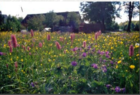
Storchschnabelwiese in Hermsdorf/E.

typische Arten: Wald-Storchschnabel (im Mulde- und Weißeritzgebiet häufig, im Müglitztal selten); Weicher Pippau, Wiesen-Knöterich