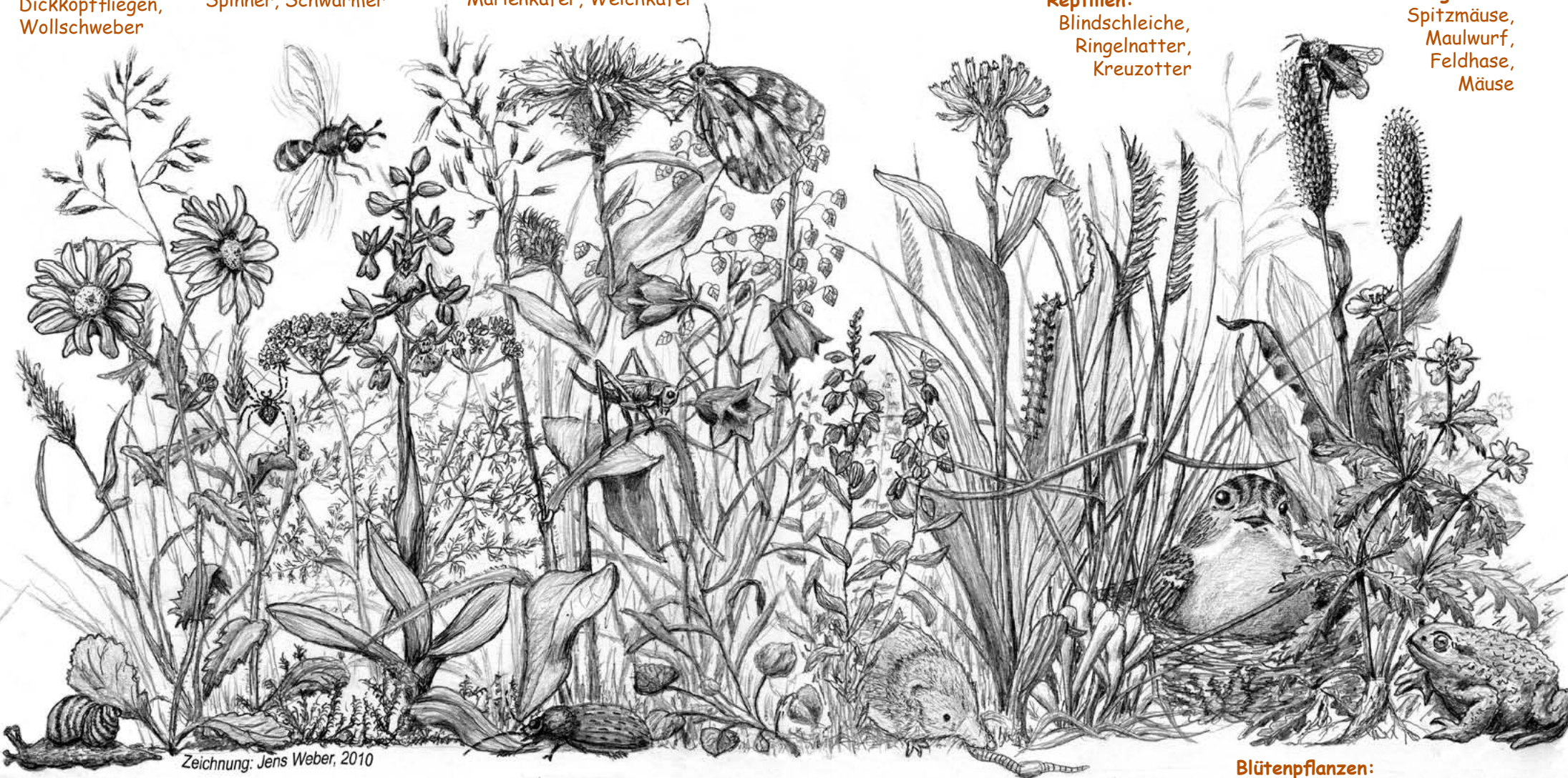
Zeichnung: Jens Weber, 2010

Säugetiere: Spitzmäuse, Maulwurf, Feldhase, Mäuse