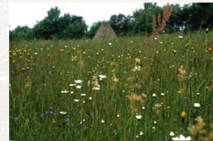
Glatthaferwiese bei Glashütte

Pflege: meist zweischürige Mahd (erster Schnitt: Juni/Juli, zweiter Schnitt: August/September), Nachweide mit Schafen oder Ziegen, gelegentliche Kalkung