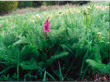
Bärwurzwiese mit Stattlichem Knabenkraut bei Lauenstein

typische Arten: Bärwurz („Köppernickel“), Weicher Pippau, Perücken-Flockenblume (im Müglitz- und Gottleubagebiet, weiter westlich selten), Ährige Teufelskralle, Kanten-Hartheu, Rundblättrige Glockenblume; feuchte Ausbildungsform: Alantdistel, Wiesen-Knöterich