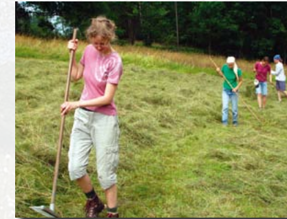
Bis zu einhundert Heulager-Helfer kommen alljährlich aus Nah und Fern ins Bärensteiner Bielatal.

Darüber hinaus organisiert die Grüne Liga Osterzgebirge im August immer das einwöchige Schellerhauer Naturschutzpraktikum . Dieses richtet sich in erster Linie an Studenten und andere interessierte Jugendliche.