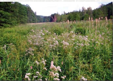
Hochstaudenflur mit Echtem Baldrian im Chemnitzbachtal – von einem geplanten Hochwasserdamm bedroht

Pflege: Mahd im Sommer (bei ausreichender Trockenheit mit Heugewinnung, aber auf alle Fälle Entfernung der Grünmasse), gegebenenfalls zweiter Schnitt im Frühherbst; gelegentliche Kalkung