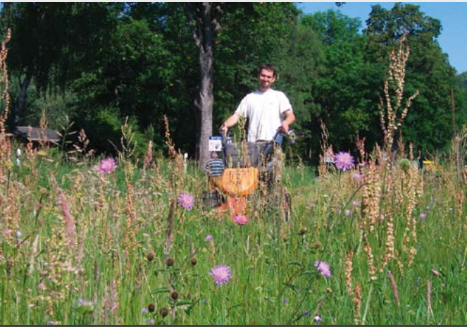
Mahd einer Naturschutzwiese mit Einachsmäher

Inzwischen hat sich das Blatt aber erneut gewendet. Die Bedingungen für staatlich geförderte Biotoppflege werden immer ungünstiger, gleichzeitig nimmt die Intensität der Landnutzung wieder deutlich zu. Raps und Mais beherrschen die Landschaft, die Nachfrage nach gutem, kräuterreichem Gebirgs-wiesenheu stagniert.