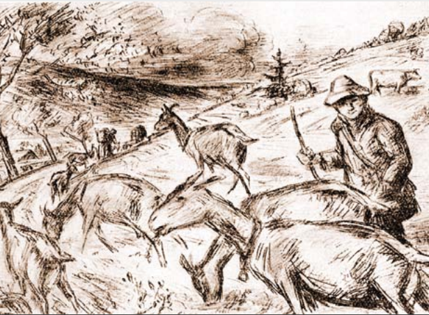
Die Ziege war das wichtigste Haustier im oberen Erzgebirge.

Bauern nahmen dann alle Böden unter den Pflug, die ihnen nicht zu nass, nicht zu steil und nicht zu steinig schienen. Meistens blieb der Ertrag der kaum gedüngten Äcker sehr bescheiden. Vor allem im oberen Bergland waren nach einigen Ernten viele Jahren Brache erforderlich, bis sich die Bodenfruchtbarkeit regenerieren konnte. Von Zeit zu Zeit weideten die großen gutsherrschaftlichen Schafherden diese Flächen ab – und sorgten für gute Wuchsbedingungen heutiger Magerwiesenarten.