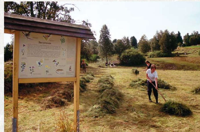
Im Naturschutzgebiet Schellerhauer Weißeritzwiesen findet seit 1996 alljährlich das Naturschutzpraktikum der Grünen Liga Osterzgebirge statt.