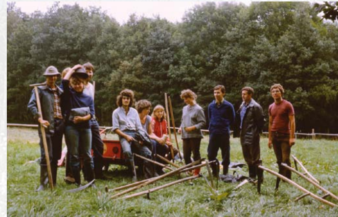
Dank der zwischen Ende der 1970er und Anfang der 1990er Jahren in Oelsen durchgeführten Studentensommer der TU Dresden konnten dort einige sehr wertvolle Wiesen bewahrt werden.