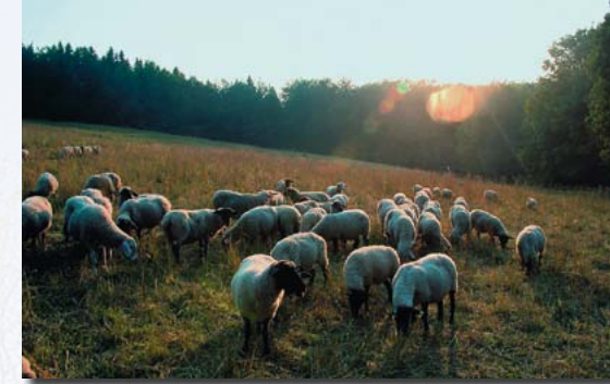
Wiesen brauchen Mahd – doch Nachbeweidung mit Schafen (oder Ziegen) verbessert für viele Pflanzenarten die Wuchsbedingungen.

Auf keinen Fall nichtheimische Saatmischungen aus dem Gartenmarkt kaufen. Die meisten der darin enthaltenen Blumen können sich ohnehin nicht dauerhaft etablieren. Viel besser ist der Scheunen-Kehricht, der dort anfällt, wo auf artenreichen Wiesen Heu gemacht wird – zum Beispiel bei der Grünen Liga Osterzgebirge.