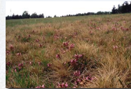
Borstgrasrasen mit Waldläusekraut in Zinnwald

Pflege: jährliche Mahd mit Grünmasseberäumung (kein gutes Heu), bei nicht zu feuchten Flächen auch Beweidung mit Schafen und Mahd im Wechsel möglich