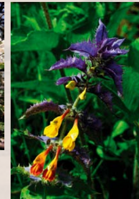
Hain-Wachtelweizen: gefährdet