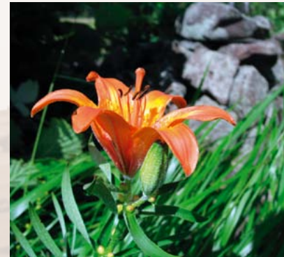
Feuer-Lilie: vom Aussterben bedroht

Vor allem aber macht ihr enormer biologischer Reichtum die Steinrücken so schützenswert. Unter den hier lebenden Pflanzen und Tieren befinden sich zahlreiche Arten der Roten Listen. Eine kleine Auswahl der in Sachsen gefährdeten Pflanzen, die auf den Steinrücken des Ost-Erzgebirges Refugien gefunden haben: