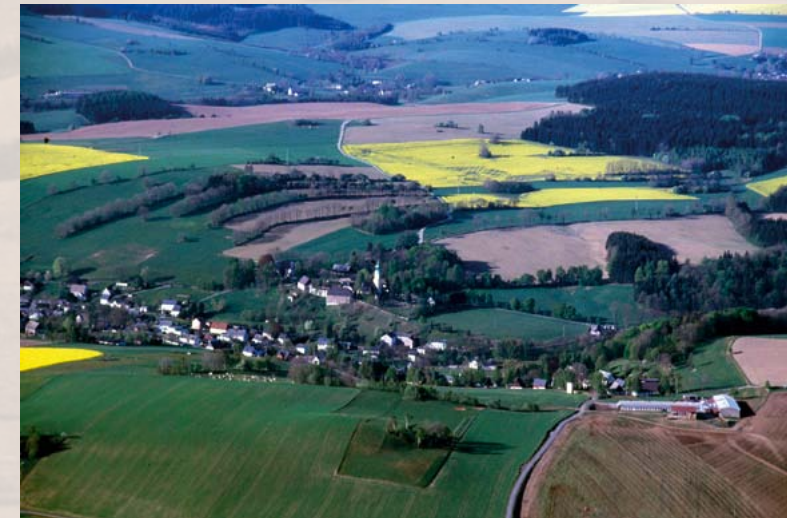
Steinrückenlandschaft um Dorfchemnitz