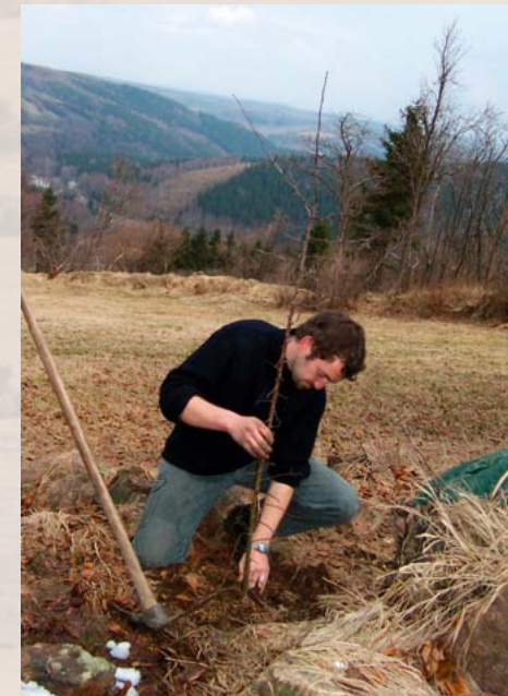
Wildäpfelpflanzung der Grünen Liga an der Sachsenhöhe

Dem Wildäpfel gebührt bei der Steinrücken-pflege besondere Aufmerksamkeit, damit dem Holzäpfelgebirge diese schönen und wertvollen Gehölze erhalten bleiben!