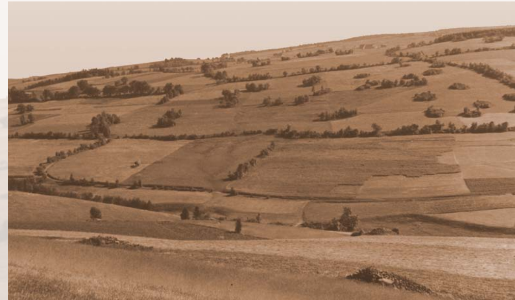
Geisinger Hirtenwiesengrund vor hundert Jahren: Ganz so kahl sollten Steinrücken heute nicht wieder werden!

Die nach dir kommen, werden dein edles Tun zu schätzen wissen.