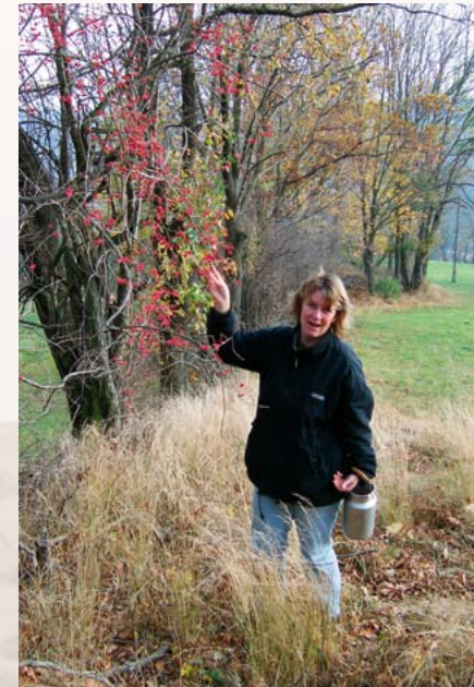
Mitarbeiterin der Grünen Liga beim Beernten heimischer Gehölze

Deshalb bemühen sich die Grüne Liga Osterzgebirge und der Landschaftspflegeverband mit einigen regionalen Baumschulen um die Anzucht von so genannten autochthonen („gebietsheimischen“) Gehölzen.