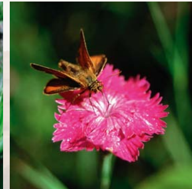
Busch-Nelke: stark gefährdet Dickkopffalter auf Buschnelke