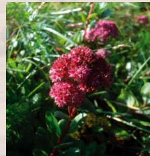
Purpur-Fetthenne: im Rückgang