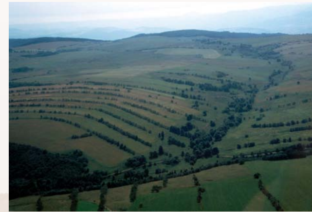
Der Ort Ebersdorf/Habartice ist zerstört, die Steinrücken haben überlebt.

Insbesondere die Gehölzvegetation der Steinrücken ist außerordentlich bunt und vielfältig. Nahezu alle einheimischen Bäume und Sträucher finden sich auch irgendwo auf den Steinrücken des Ost-Erzgebirges. Dies ist zum einen zufallsbeeinflusst – je nachdem, wo sich ein Zugvogel zur Notdurft niederlässt, kann später der Samen keimen, den er uns bescherte. Zum zweiten spielt die Nutzung der Gehölze in der Vergangenheit und Gegenwart eine entscheidende Rolle. Drittens macht sich auch die landwirtschaftliche Nutzung der umliegenden Bereiche bemerkbar. Und viertens spiegelt die Zusammensetzung der Artengemeinschaft auch die natürlichen Standortbedingungen wider.