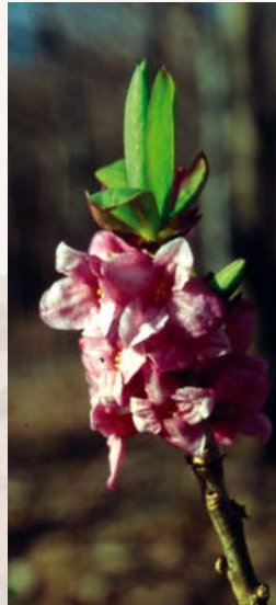
Seidelbast: gefährdet