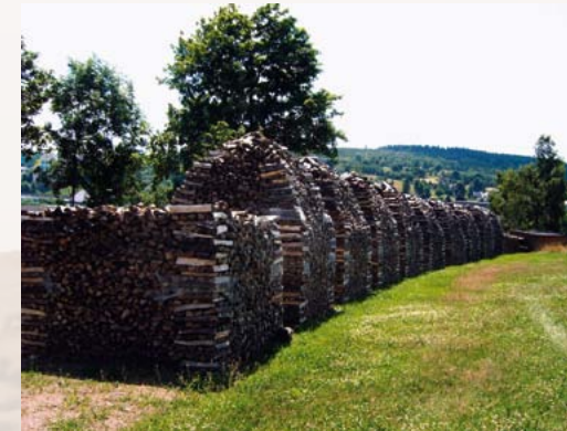
Holzfeimen bei Hirschsprung