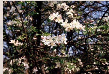
Wild-Apfel: gefährdet