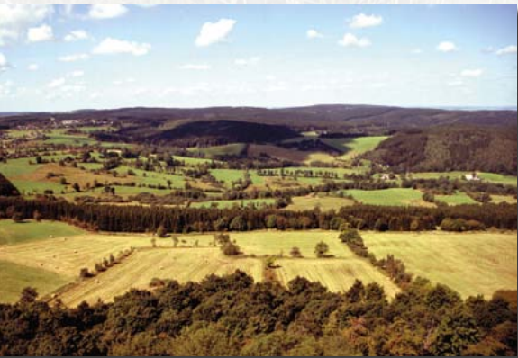
Steinrücken am Westhang des Geisingbergs

Von dieser mühsamen Feldwirtschaft zeugen die etwa 100 Steinrücken rings um den Geisingberg, die zusammen rund zwölf Kilometer Länge ergeben, plus zahlreiche „Steinhorste“ (Lesesteinhaufen). Die Steinrücken erstrecken sich hier nicht als parallele Hufenstreifenbegrenzungen, wie bei den Waldhufendörfern der ersten Besiedlungsphase, sondern bilden ein unregelmäßiges Mosaik. Bis in die Mitte des 20. Jahrhunderts wurden auch die Gehölze der Steinrücken genutzt: als Brennmaterial für Öfen und Herde. Als dann, mit Einzug der Kohle als Hauptenergiequelle, das damit verbundene, regelmäßige „Auf-Stock-setzen“ ausblieb, wuchsen die Gehölze zu großen, schattenwerfenden Bäumen heran. Eine der heutigen Naturschutzmaßnahmen im Gebiet besteht darin, die Gehölze wieder auszulichten, um den einstigen offenen Charakter der Steinrücken wiederherzustellen.