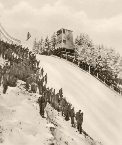
Sprungchanze am Geisingberg