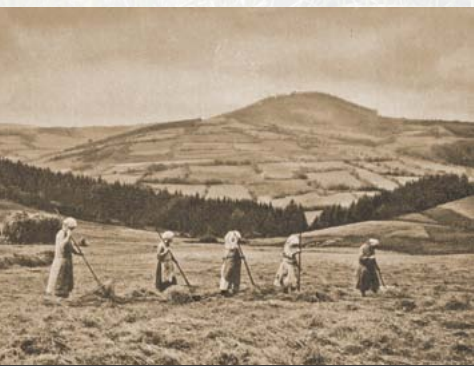
Heuwenden am Geisingberg

war hier 1937 mit den deutschen Skimeisterschaften erreicht, als sich unvorstellbare 40.000 Zuschauer am Geisingberg versammelt haben sollen.