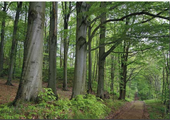
Buchen-Altbestand am Südost-Hang

Der große Blockhang auf der Westseite der Geisingbergkuppe wird von einem lockeren Bestand aus Berg-Ahorn, Eschen, einzelnen Winter-Linden und angepflanzten Zirbel-Kiefern überschirmt. Die Basaltblöcke sind mit teilweise seltenen Moosen überzogen, dazwischen wachsen verschiedene Farne sowie Bingelkraut, Lungenkraut, Süße Wolfsmilch und weitere anspruchsvollere Laubwaldpflanzen.