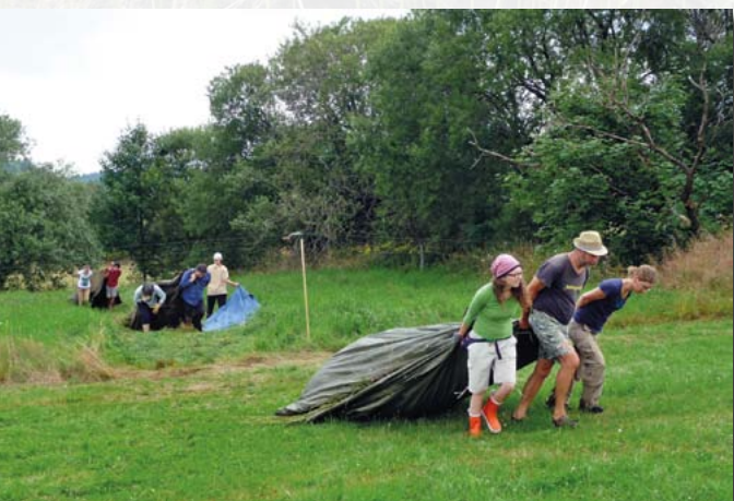
Naturschutz ist mühsam, macht aber Spaß.