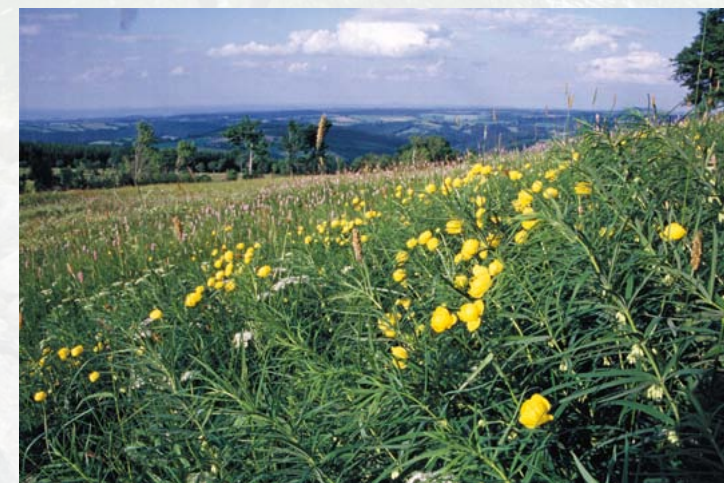
Trollblumen profitieren vom Mineralreichtum des Basalts

Das engräumige Aufeinandertreffen sehr unterschiedlicher Gesteine bedingt eine breite Palette von ökologischen Bedingungen. Dabei wirkt der Basalt beträchtlich über sein eigentliches Vorkommen hinaus: Das offenbar über viele Monate in seinen Klüften gespeicherte Niederschlagswasser reichert sich dort mit pflanzennotwendigen Mineralstoffen an (v.a. Kalzium-, Magnesium- und Phosphorverbindungen). Schließlich tritt es am Fuße des Berges wieder aus und beeinflusst damit auch größere Bereiche der Geisingbergwiesen. Diese basischen Sickerwässer sind verantwortlich dafür, dass sich anspruchsvollere Pflanzenarten wie Trollblumen, Stattliches Knabenkraut und Große Sterndolde hier in beachtlichen Populationsgrößen erhalten konnten, während sie andernorts durch die „Sauren Niederschläge“ ihre Existenzgrundlage verlieren.