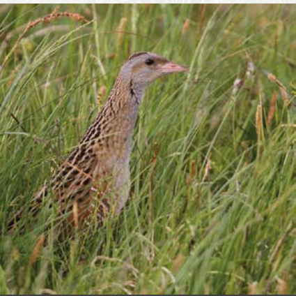
Europäisches Schutzgebiet: unter anderem für den Wachtelkönig

Im Jahr 2000 wurde eine neue Schutzgebietsverordnung erlassen, die die beiden bis dahin selbständigen Naturschutzgebiete vereinigte – und die Gesamtfläche von 47 auf 314 Hektar erweiterte. Die alten Bezeichnungen sind noch im Namen des FFH-Gebiets „Geisingberg und Geisingbergwiesen“ (FFH: Schutzgebiet entsprechend der sogenannten Fauna-Flora-Habitat-Richtlinie der Europäischen Union) sowie des gleichnamigen EU-Vogelschutzgebiets enthalten. Mit beiden Schutzgebietskategorien gehört der Geisingberg zu den wichtigen Knotenpunkten des europäischen Netzes „Natura 2000“.