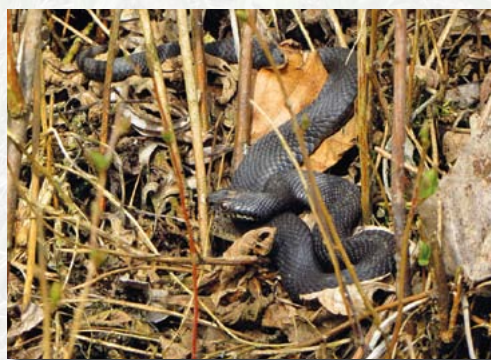
„Höllenotter“ – eine schwarze Form der Kreuzotter ohne Zickzack-Linie