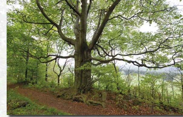
Alte Hutebuche am westlichen Waldrand

Überfordert mit dem enormen Holzbedarf insbesondere des Bergbaus waren die Wälder rund um Altenberg. Wie auf vielen anderen Waldflächen wuchsen auf dem Geisingberg im 18./19. Jahrhundert kaum noch nutzbare Bäume. An dessen westlichen Waldrand stehen allerdings einige alte Buchen, deren Stammumfänge ein Alter von 200 Jahren oder mehr nahelegen. Ihrem breitkronigen Habitus nach muss es sich um sogenannte Hutebuchen gehandelt haben. Deren Bucheckern boten dem Vieh – vor allem Ziegen – energiereiche Herbstnahrung vor den langen, kalten Erzgebirgswintern.