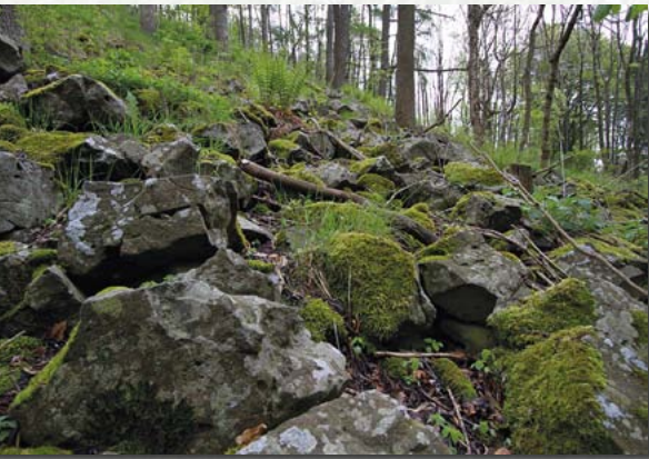
Blockhalde am Westhang

flachen Talmulden der damaligen Landoberfläche und erstarrte schließlich zu „Pfropfen“ innerhalb dieser Täler. In den nachfolgenden Jahrtausenden wurde die Landoberfläche abgetragen, aus dem „Pfropfen“ wurde ein Berg.