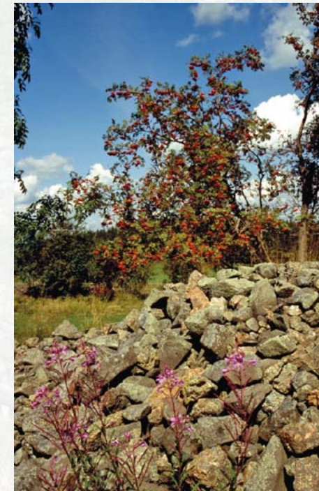
Granitporphyr-Steinrücke mit Eberesche und Schmalblättrigem Weidenröschen

Typische Arten der lichtoffenen Steinrücken sind hingegen Heidelbeere, Purpur-Fetthenne und der auffällige Hain-Wachtelweizen mit sei-