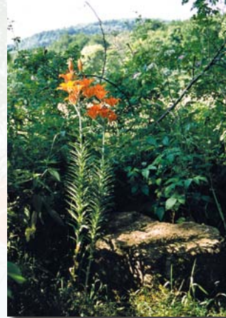
Feuer-Lilie (besonders großes Exemplar am Mendesbusch)

Der große Blockhang auf der Westseite der Geisingbergkuppe wird von einem lockeren Bestand aus Berg-Ahorn, Eschen, einzelnen Winter-Linden und angepflanzten Zirbel-Kiefern überschirmt. Die Basaltblöcke sind mit teilweise seltenen Moosen überzogen, dazwischen wachsen verschiedene Farne sowie Bingelkraut, Lungenkraut, Süße Wolfsmilch und weitere anspruchsvollere Laubwaldpflanzen.