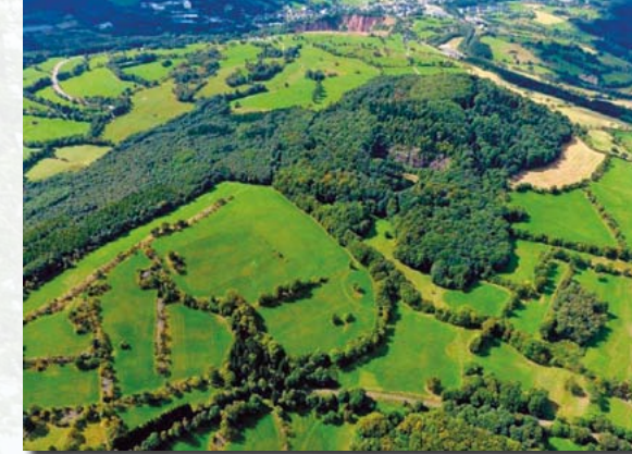
Geisingberg und Geisingwiesen

Wenngleich mit 824 Metern viel niedriger als der Erzgebirgskamm (höchste Erhebung im Ost-Erzgebirge: Wieselstein/Loučná, 956 m), so stellt der Geisinggipfel doch eine weithin sichtbare Landmarke dar. Der harte Basalt bot den Kräften der Gebirgsabtragung wesentlich mehr Widerstand als das meiste andere Gestein, weshalb fließendes Wasser nach der Anhebung und Schrägstellung der Erzgebirgsscholle (vor ca. 25 Millionen Jahren) den Berg freistellte. Nach anfänglich flächiger Erosion der Landoberfläche begannen sich dann die Fließgewässer immer tiefer in die Hochfläche einzugraben und die osterzgebirgstypischen Kerbsohlentäler zu formen. Eines davon, der Geisinggrund, gehört dem linken Zufluss der Müglitz, der den Namen Rotes Wasser trägt (wegen der rotgefärbten Aufbereitungsschlämme des Zinnbergbaus, die jahrhundertlang über den Bach entsorgt wurden). Beeindruckend ist der Blick von den östlichen Hängen des Geisinggrundes auf den Geisingberg. Mit knapp 300 Metern Höhenunterschied auf 1200 Metern Distanz hat man eine der höchsten Bergflanken der Region vor sich – vom Steilabbruch der Erzgebirgsscholle ins Nordböhmisches Becken natürlich abgesehen.