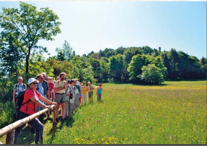
Geisingbergführungen immer am Pfingstmontag

Immer am Pfingstmontag betreut die Grüne Liga Osterzgebirge auf dem Geisinggipfel einen Informationsstand und bietet von hier aus vier jeweils anderthalbstündige Führungen um den Berg an („Pfingst-Naturerlebnis Geisingberg“).