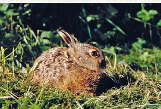
Junger Feldhase am Geisingberg

reduziert. Viele Exemplare werden auf Straßen überfahren oder landen in den Mähwerken moderner Landwirtschaftsmaschinen. In großen Teilen Sachsens ist die Kreuzotter in den letzten Jahren offenbar verschwunden.