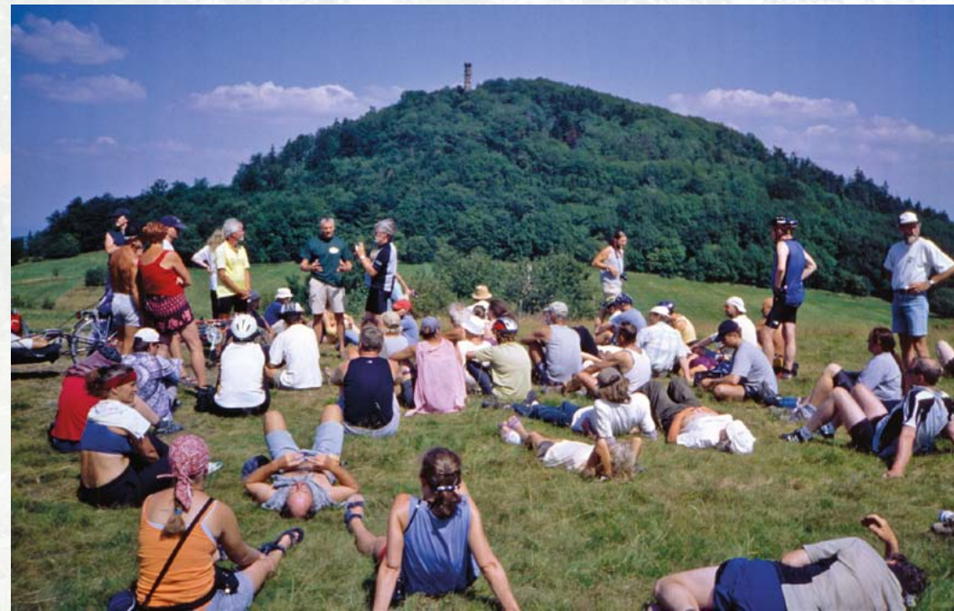
2004 machte die „Tour de Natur“ – eine bundesweite Radfahrerininitiative – Station am Geisingberg.

Der Geisingberg ist zweifellos eines der lohnendsten Ausflugsziele im Ost-Erzgebirge, gut zu erreichen mit der Müglitztalbahn und der Buslinie Dresden – Altenberg (– Teplice). Vom 18 m hohen Aussichtsturm hat man einen eindrucksvollen Rundblick, besonders in Richtung Osten und Norden, weit über das Elbtal hinaus. Eintrittskarten sowie viele interessante Informationen bekommt man in der Geisingbergbaude.