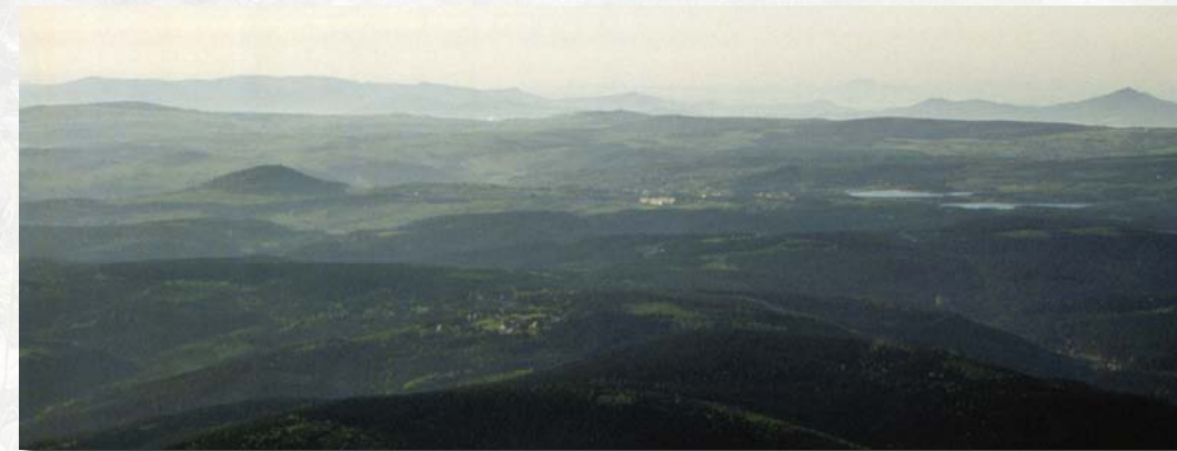
Geisingberg (links), aufgelagert auf der Erzgebirgs-Pultscholle (im Hintergrund: Böhmisches Mittelgebirge)