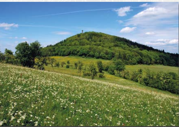
Heidehübel (Quarzporphyr) im Vordergrund, Geisingberg (Basalt) im Hintergrund, dazwischen Gneis-Senke

Das Basaltvorkommen – geologisch exakter: Olivin-Augit-Nephelinit – hat einen Durchmesser von lediglich rund 500 Metern. Die Hänge des Geisingberges, besonders auf der Westseite, sind übersät mit Basaltblöcken, die während der Eiszeiten durch in den Gesteinsklüften gefrierendes Wasser entstanden (Eis dehnt sich bei weiterer Abkühlung aus und kann dabei Felsen „sprengen“). Eine üppige Flora zeugt vom basischen Charakter des Basalts.