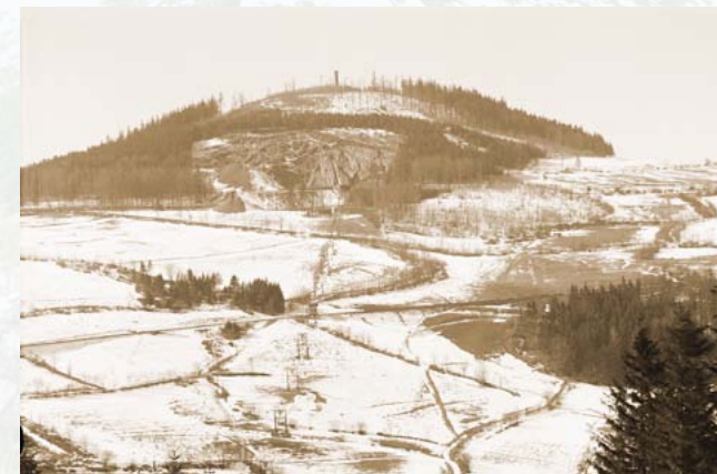
Steinbruch am Geisingberg, vor 1930

Zur selben Zeit wuchs der an der Ostflanke seit langem betriebene Steinbruch zu einer ernsthaften Bedrohung der Basaltkuppe. Mit medienwirksamen Initiativen gelang es dem Landesverein, den Steinbruch 1930 stillzulegen. Dessen tiefe Sohle füllte sich danach mit Wasser zu einem sehr klaren „Berg- see“. Leider wurde das zu- und abflusslose Gewässer seit den 1990er Jahren durch (illegalen) Badebetrieb sowie – noch schlimmer – durch das Einsetzen und Füttern von Fischen so stark verschmutzt, dass die einstmals hier vorkommenden, seltenen Wasserinsekten ver- schwunden sind.