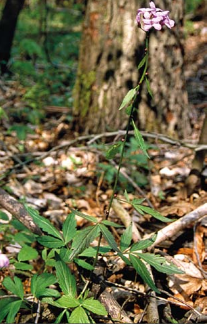
Zwiebel-Zahnwurz – namensgebende Art reicher Gebirgs-Buchenwälder