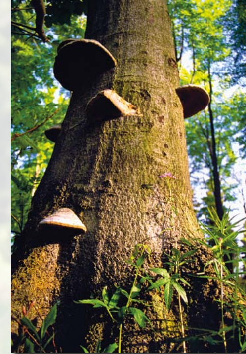
Auch absterbende Bäume sind wichtig im Wald.

reiche weitere Pflanzenarten Vielfalt in die Krautschicht. Hier handelt es sich um Waldmeister-Buchenwald bzw. um dessen Gebirgsform, den Zwiebelzahnwurz-Buchenwald. Waldmeister und die im Mai wunderschön blauviolett blühende (danach aber schon bald von Rehen kräftig abgefressene) Zwiebel-Zahnwurz sind im NSG Trostgrund verbreitet zu finden, außerdem Goldnessel,