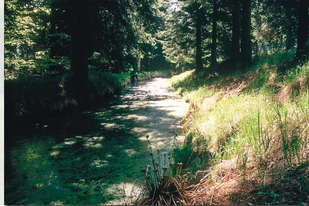
Floßgraben bei Cämmerswalde

Und immer mehr Gewerke mit Holzbedarf siedelten sich im oberen Muldental selbst an, zum Beispiel ein Sägewerk, aus dem sich mit dem Bau der Eisenbahn der Ort Bienenmühle entwickelte.