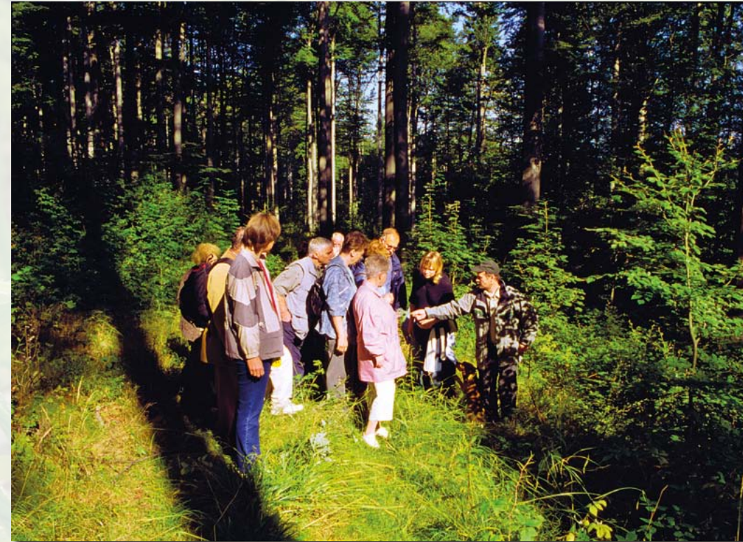
Naturkundliche Wanderung der Grünen Liga Osterzgebirge mit dem Revierförster (2005)

Am Ökobad Rechenberg (Muldenalstraße Richtung Bienenmühle) befindet sich seit 2014 ein Infopunkt des Naturparks Erzgebirge/Vogtland.