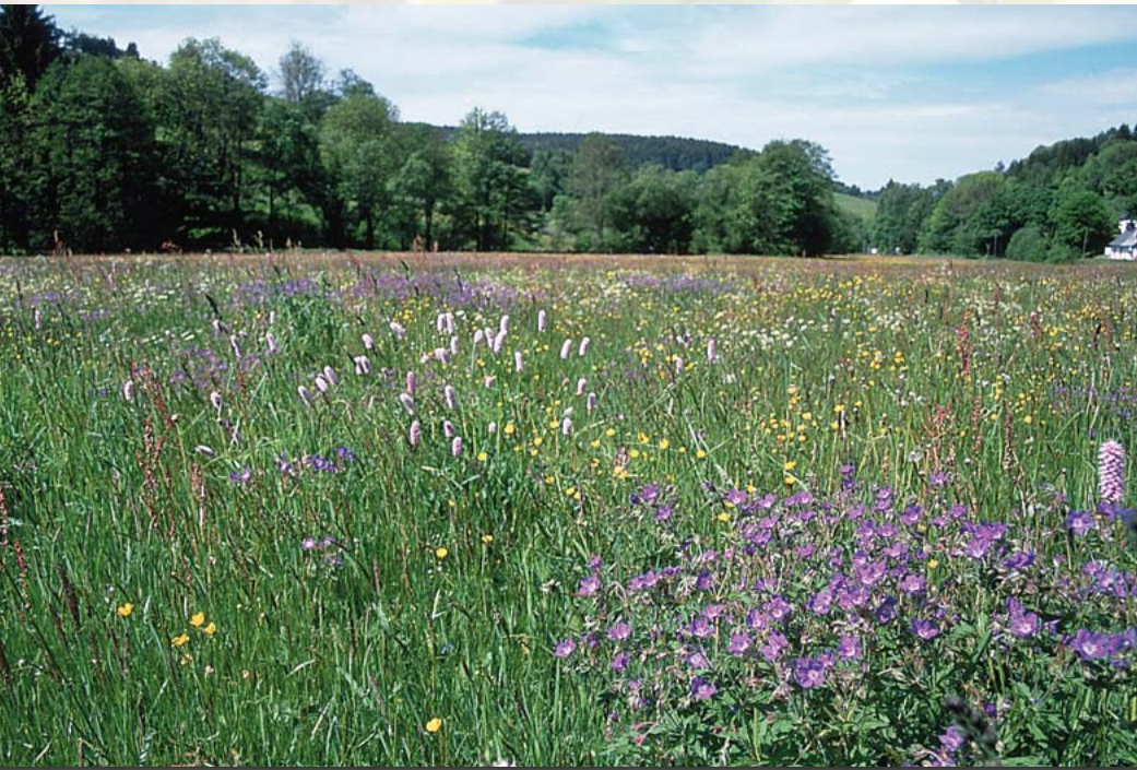
Muldenaue bei Rechenberg – mit Wald-Storchschnabel, Wiesenknöterich und vielen weiteren Mähwiesenarten