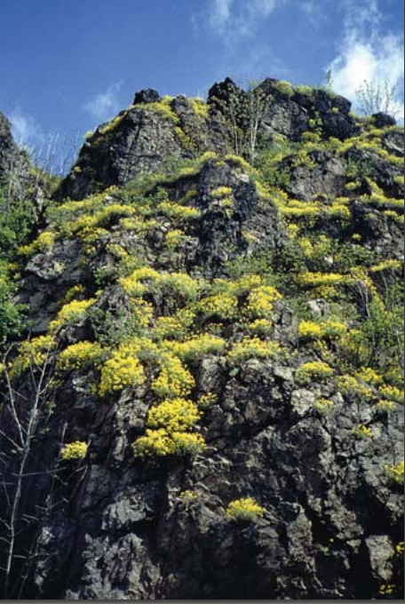
Die Burg Rechenberg thronte einst auf diesem Felsen. Im April leuchten Blüten des Felsen-Steinkrauts.

Regierungsbezirksgrenze Chemnitz/Dresden und umfasst damit auch die Gemeinde Rechenberg-Bienenmühle.