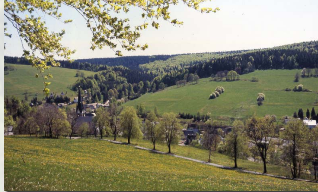
Rechenberger Kirche, dahinter der Trostgrund. Hellgrün hebt sich der Buchenwald des NSG ab.

Anders, als es die Bezeichnung vermuten lässt, tangiert das Naturschutzgebiet Trostgrund den Bach gleichen Namens nur auf reichlich 100 Metern Lauflänge im Nordosten. Das NSG umfasst vielmehr den Nordost-exponierten Hangbereich des unteren Trostgrundes, südlich des Kälberhübels. Mit gerade einmal 26 Hektar handelt es sich zwar um ein relativ kleines Schutzgebiet (das sechstkleinste der 20 Osterzgebirgs-NSG auf deutscher Seite), doch steigt es von 600 m Höhenlage am Trostgrundbach bis auf rund 720 m in der Nähe des Ringelwegs an und umfasst eine breite Standortpalette.