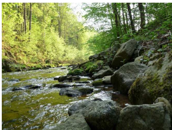
Die Müglitz in einem reizvollen Tal zwischen Schlottwitz und Glashütte, Foto: Jens Weber

Bitte planen Sie Ihre Verpflegung aus dem Rucksack ein. Sie erreichen den Bahnhof mit dem ÖPNV. Parkplätze stehen in beschränkter Zahl zur Verfügung. Die Führung ist kostenfrei. Eintritt Schloss 4,00 €.